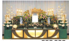
あじさいコース 税込価格 693,000円