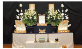
しゃくなげコース 税込価格 473,000円

※赤字はコープ葬以外では別途料金になる場合がございます。 ※追加料金…ご葬家のご希望や日程の関係で、基本料金に含まれるサービスの水準や数量を超えた場合に発生する料金です。 ※別途料金…「基本料金」および「追加料金」があり得るもの」に含まれない料金です。 ※寺院等へのお布施及び戒名料等は葬儀より直接のお支払いとなります。