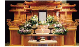
しらゆりコース 税込価格803,000円