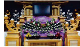
あじさいコース 税込価格693,000円