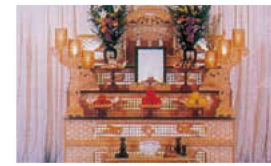
はまなすコース 税込価格583,000円