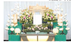
はまなすコース 税込価格 583,000円