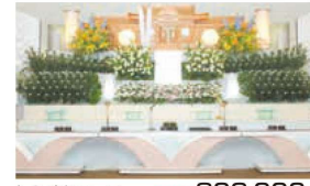
しらゆりコース 税込価格 803,000円