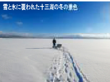
雪と水に覆われた十三湖の冬の景色