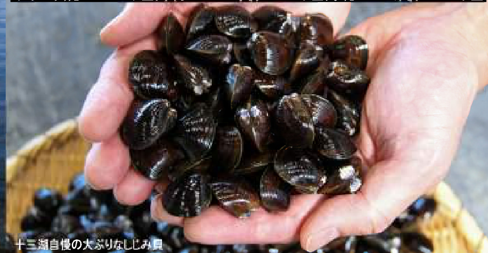
十三湖自慢の大ぶりなしじみ貝

サイズ：大粒17.4mm以上、中粒17.4mm未満15mm以上、小粒15mm未満12mm以上