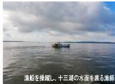
漁船を操縦し、十三湖の水面を渡る漁師