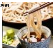
東津軽郡今別町北相産業有限公司